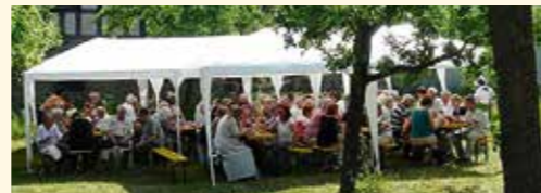
Kaffeetrinken im Pfarrgarten